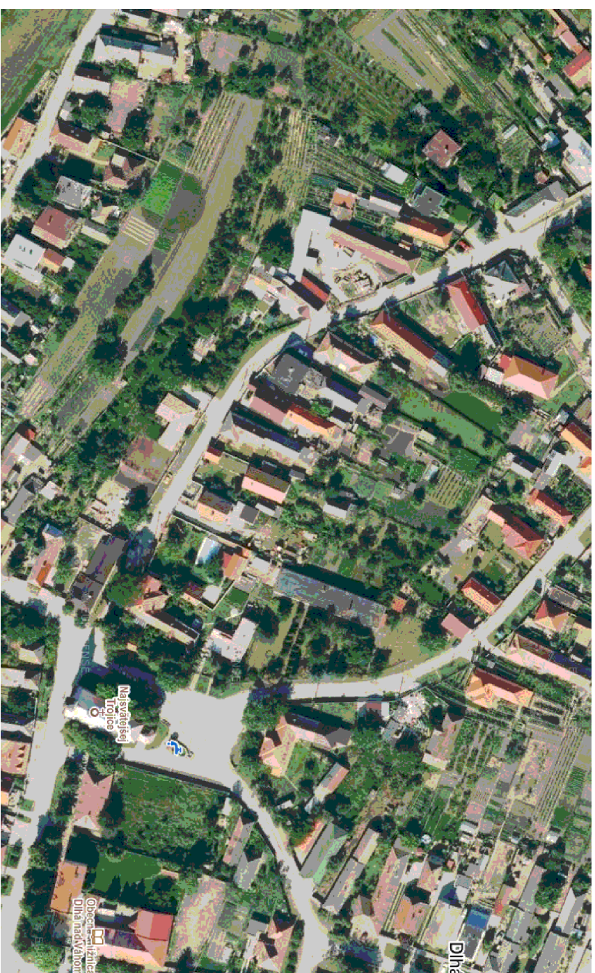
ÚZEMIE NA PODKLADE SATELITNEJ MAPY